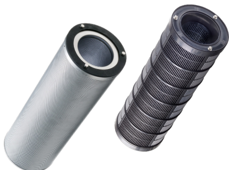
Esempi di tipi di filtri appropriati per il CamCube CC